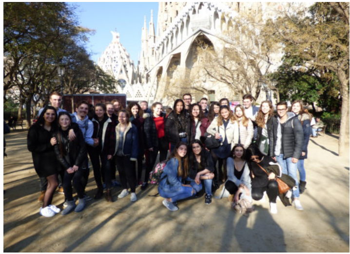
Vor der Sagrada Familia

Hola amigos, am Mittwoch, den 14.02.2018 haben wir uns, die Spanischlernenden des Leistungskurses der Jahrgangsstufe 11 und des Grundkurses der Jahrgangsstufe 11 und 12, auf den Weg nach Barcelona gemacht. Nachdem unser Flieger überpünktlich landete, sind wir mit dem Bus in die Stadt zu unserem Hotel