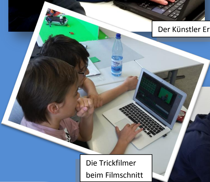
Die Trickfilmer beim Filmschnitt