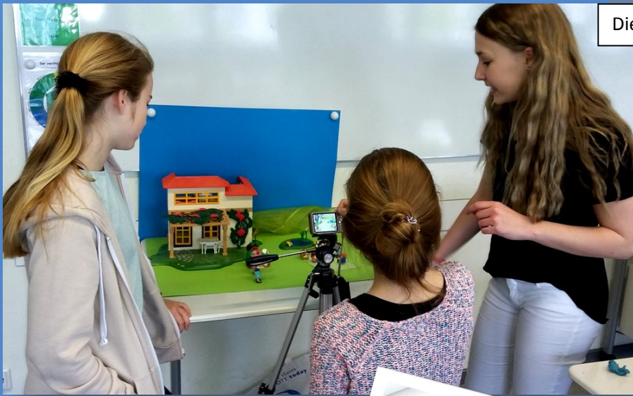
Die Filmteams bei der Arbeit an den Filmkulissen