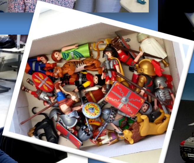
Die „Schauspieler“ und Requisiten